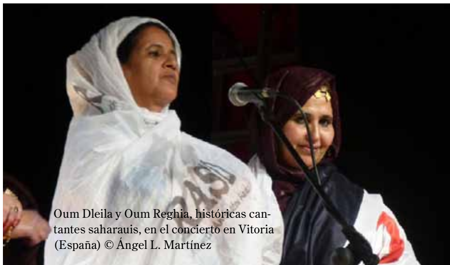
Oum Dleila y Oum Reghia, históricas cantantes saharauis, en el concierto en Vitoria (España)

Youtube: http://www.youtube.com/user/SandblastArts