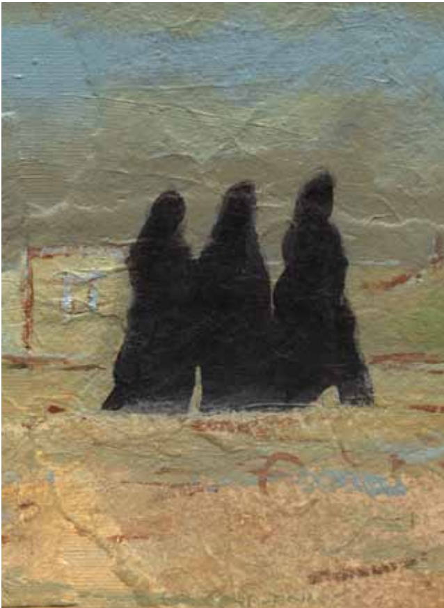
Imagen: Isabel Fiadeiro