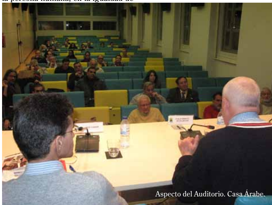
Aspecto del Auditorio. Casa Árabe.