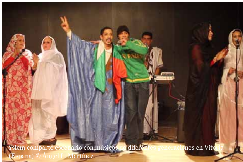
Yslem comparte escenario con músicos de diferentes generaciones en Vitoria (España)