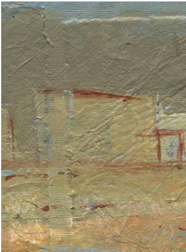
Imagen: Isabel Fiadeiro