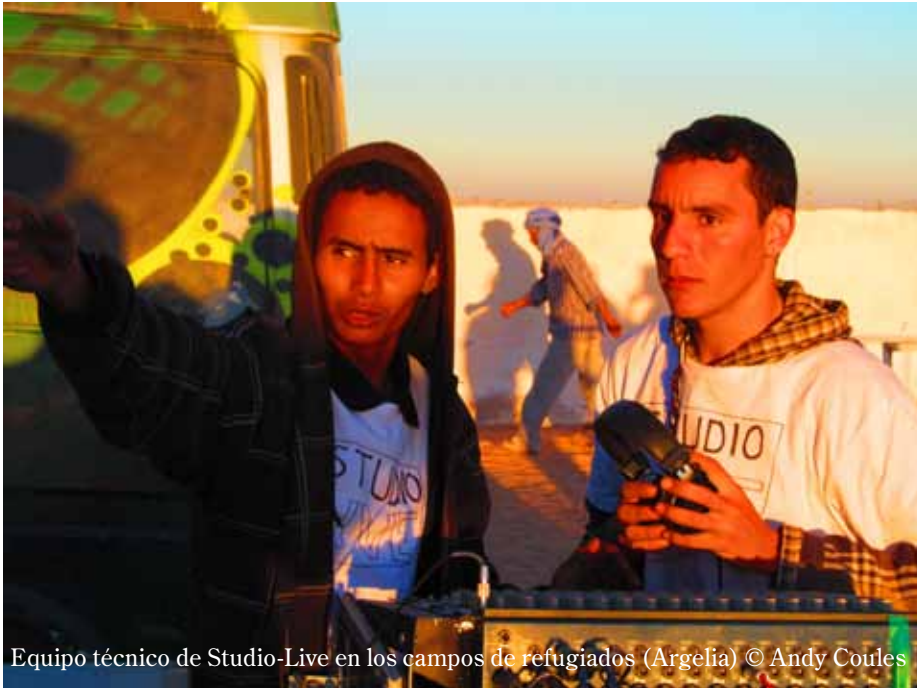
Equipo técnico de Studio-Live en los campos de refugiados (Argelia)

la lucha del pueblo saharauí, destacando la ausencia de especialistas en el campo de la etnomusicología y de un sistema científico de archivado y evaluación de la música. También subrayó la necesidad de evitar la creciente contaminación de la música saharauí por los ritmos mauritano y marroquí.