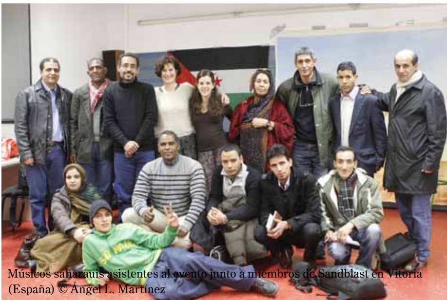
Músicos saharauís asistentes al evento junto a miembros de Sandblast en Vitoria (España)