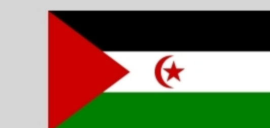
República Árabe Saharaui Democrática